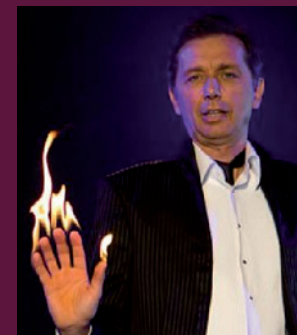
Arsene Lupin www.arsenelupin.pl