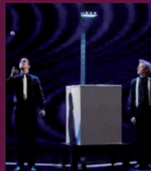
Cubic Act www.p-cubique.com