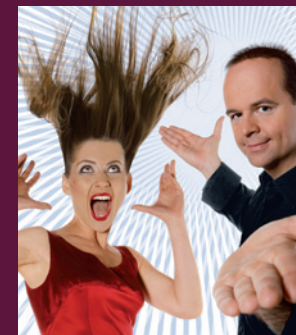
Topas & Roxanne www.topasmagic.de